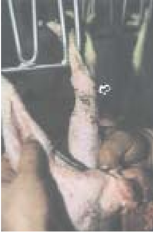
Se aprecia deteriorada la pata del ave en el lugar de la coyuntura de los tendones, afectando el status kosher del animal.

La Halachá (Ley judía) estipula que los animales que muestran una herida mortal no son kosher, incluso si han sido faenados correctamente. Aquellos animales son llamados "T'reifah" y están sujetos a prohibiciones bíblicas. El Shojet debe inspeccionar los animales y aves inmediatamente después de la Shejita para asegurar que no han sufrido esta descalificación. Este proceso es conocido como Bedikah (literalmente "inspección"). Con las aves, las inspecciones son típicamente realizadas por lesiones en sus intestinos o por lesión en la coyuntura de los tendones de la pata. Cualquier ruptura obvia de huesos, dislocaciones o una anatomía inusual de los órganos internos y material extraño encontrado en las cavidades del cuerpo son asunto de exámenes más detalladas y posibles descalificaciones.